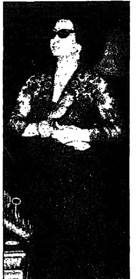
السيدة أم كلثوم

لم يكن ترشيحي لاداء شخصية أم كلثوم مفاجأة فقد كنت أتوقع ان تستدني للفرجة النشيطة اتعام محمد علي دور أم كلثوم في فيلمها التلفزيوني وعصر من الغناء الجميل وأنا في غاية الريب من شخصية هذه السيدة العظيمة فهي ليست شخصية ولكنها تحتاج لدراسة جادة ودقيقة وسأحاول ان ألم بها من خلال قراءتي للمتعددة.